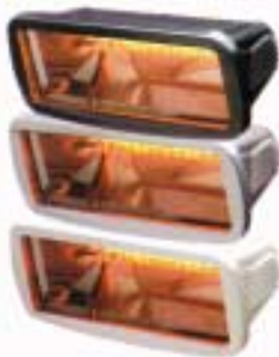
Gama de colores Negro, Plata y Blanco