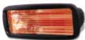
Algarve 2,0 Kw.