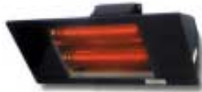
Bermuda 3,0 Kw. Con refrigeración de la lámpara