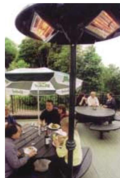
Farola Riviera para exteriores