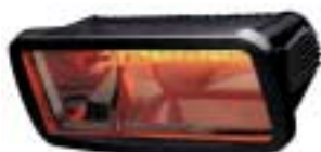
Algarve 1,3 Kw.