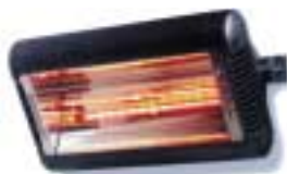
Sorrento 1,5 y 2,0 Kw.