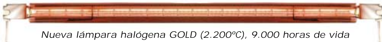
Nueva lámpara halógena GOLD (2.200°C), 9.000 horas de vida