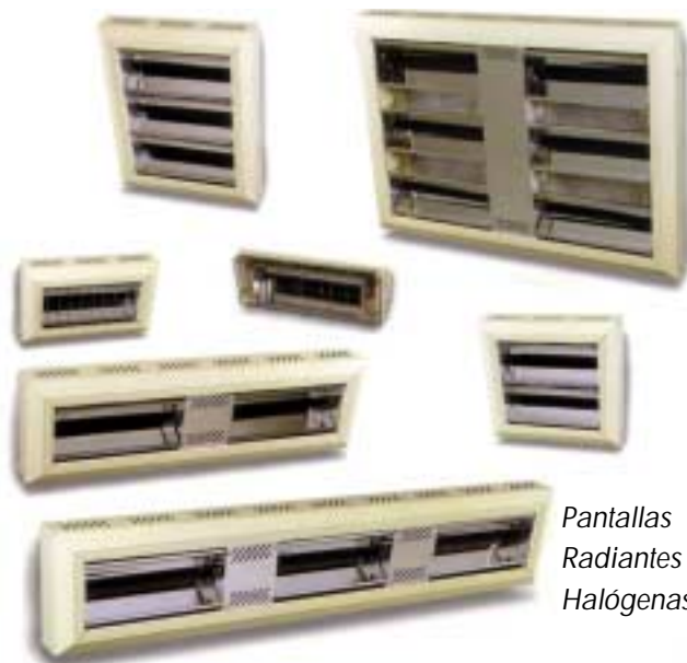
Pantallas Radiantes Halógenas